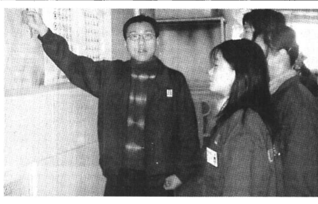
东营区胜利街道安全生产常抓不懈,他们以举办培训班、张贴宣传画册等形式教育广大职工,切实增强他们的安全意识。

针对近期我市公路“三乱”问题有所抬头的实际,我市决定从4月1日起在全市范围内开展为期一个月的治理检查。检查内容为高速公路、绿色通道、国道和省道是否畅通;收费站(点)清理整顿情况,不符合规定的收费站(点)设施是否拆除;收费、检查站(点)执法人员是否持证上岗;是否乱设卡、乱收费、乱罚款;是否乱设摊、乱占道、乱摆摊;是否乱挖路、乱取土、乱堆料;是否乱设障碍、乱设限高、限宽;是否乱设标志、乱设标线;是否乱挖路、乱取土、乱堆料;是否乱设障碍、乱设限高、限宽;是否乱设标志、乱设标线。