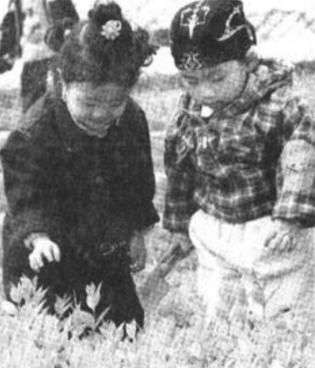
4月6日，两位小朋友被大棚内刚刚吐露嫩芽的小树苗吸引。太原市近百名家长当天带着自己的小宝宝来到位于太原市尖草坪区柴村的“爱弥尔早教中心科教基地”参加植树活动。